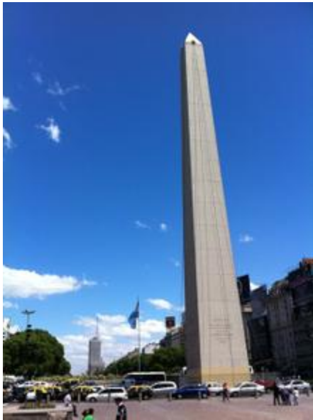
7月9日通りのオベリスコ

さて、まだまだ旅は始まったばかり。これから一旦ブエノスアイレスを離れ、サンティアゴ・デル・エステロに向かいます。フアンカや2004年以来となる友人との再会がとても楽しみです。