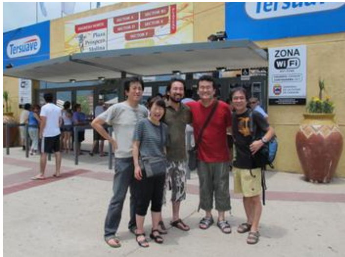
con "Los Midras" de Japon

コスキン滞在の最後の夜は演奏はお休み。プラサ（メインステージ）でのコンサートをようやくゆっくり観ることができました。第5夜はサルタのミュージシャンがたくさん出演。前日（第4夜）のオープニング・アクトで登場した「ノチェーロス」のさすがのステージすばらしかったのですが、この日最初に演奏した若手の「Canto 4」のパフォーマンスがまた圧巻でした。