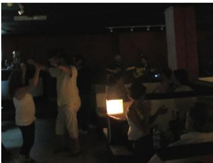
act7 “La Peña”