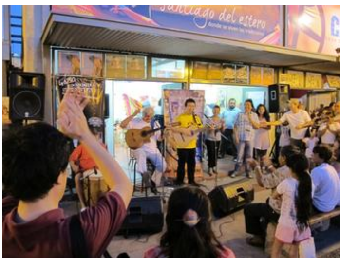
act4 "Calle San Martin"