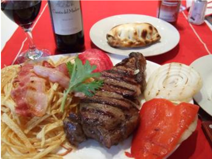
ステーキ！（ビフェ・デ・チョリソー）とウミータ（コーンクリーム）のエンパナーダ