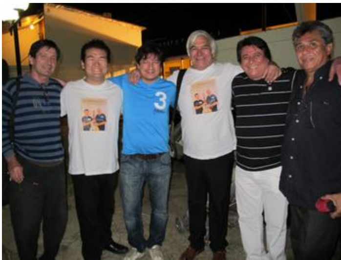
act1 "La casa de Los Carabajal"