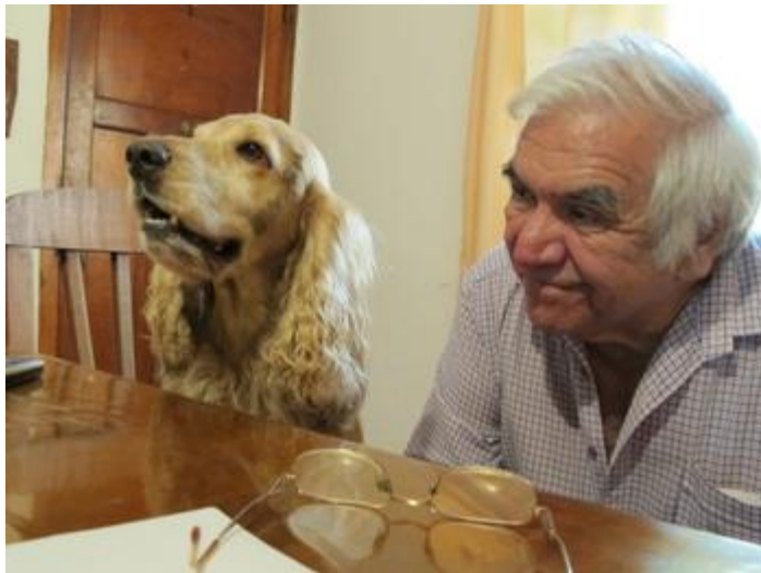
ファンカと愛犬ペピーノ

こちらはファンカに歌ってもらったサンバの動画です。撮った機材に音声リミッターがかかって40秒以降少しボリュームが小さくなってしまったのですが、マエストロの歌と近くで一緒できてうれしいです。明日も練習がんばります～