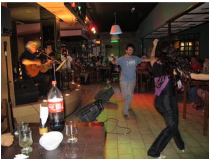
act2,3,5 "La Señalada"